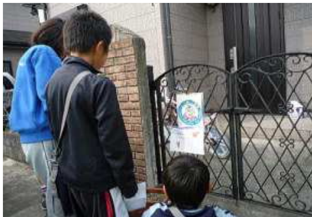
松枝学区：ピーボ君のウォークラリー