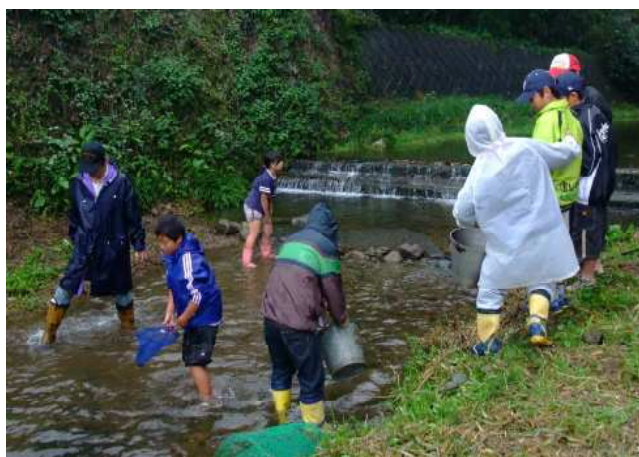
上川口学区：ますのつかみ取り大会