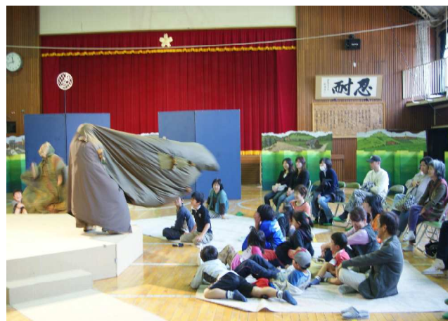
美山学区：劇団「風の子」陽気なハンス