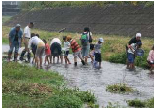
川口学区：川遊びとカレー作り