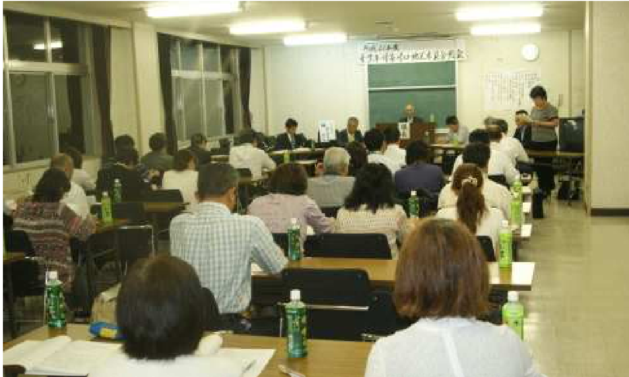
平成21年度・八王子市青少年対策川口地区委員会総会

発行：八王子市青少年対策川口地区委員会 事務局：川口中学校内 042-654-2485